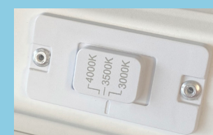
Interrupteur de température de couleur

Plus besoin de choisir un flux lumineux et une température de couleur au moment de passer votre commande, c'est le produit qui s'adapte à votre application :