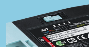
Flux lumineux réglable